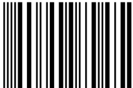
Código de barras versão comercial

A leitura do código de barras pode ser realizada na parte superior do código.