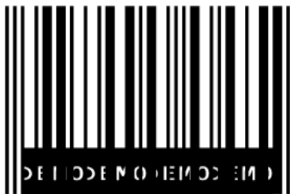
Código de barras versão de demonstração

O Pacote de Fontes de Código de Barras versão de demonstração apresenta as mesmas funcionalidades da versão comercial, contudo o código de barras gerado apresenta uma tarja preta na parte inferior, inscrição Demo em seu comprimento e alguns caracteres não estão disponíveis (ver Tabela de Mapeamento, caracteres marcados em vermelho).